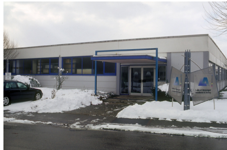
Abbildung 2a und b. Altes und neues Betriebsgebäude