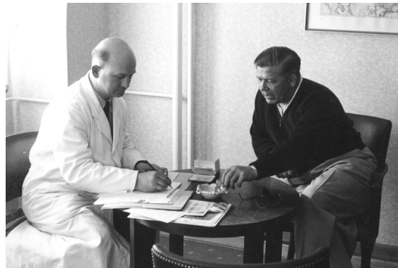
Abbildung 1b. Chefbesprechung