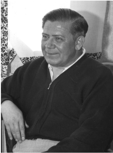
Abbildung 1a. Der Chef